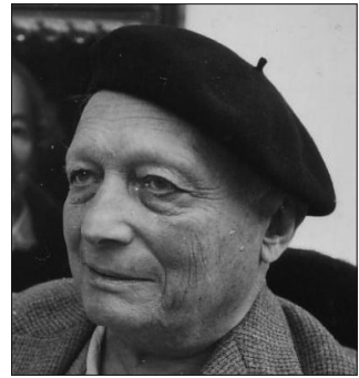
Fritz von Herzmanovsky-Orlando

Fritz von Herzmanovsky-Orlando (1877-1954) war gebürtiger Wiener. Er wird als „letztes Genie barocken österreichischen Humors“ bezeichnet, er hatte eine unbändige Lust am Fabulieren, ebenso einen spielerischen Umgang mit der Sprache. Er hatte eine Zuneigung zum