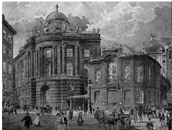
Altes Hofburgtheater am Michaelerplatz

Die europäische Theaterszene ver- sammelte sich zur Zeit von Kaiser Franz Joseph am Wiener Hofburg- theater. Die Hof- burgschauspieler- und schauspieler- innen, Deutsche aus dem Norden, Deutsche aus dem Süden, speziell aus den Habsburger- ländern, machten